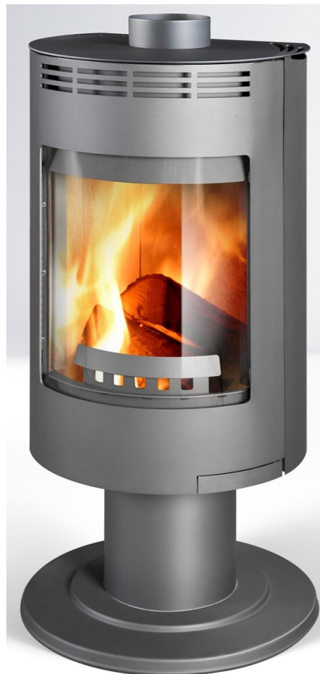
F 9489510010 - Bočný akumulčný kameň (4ks)